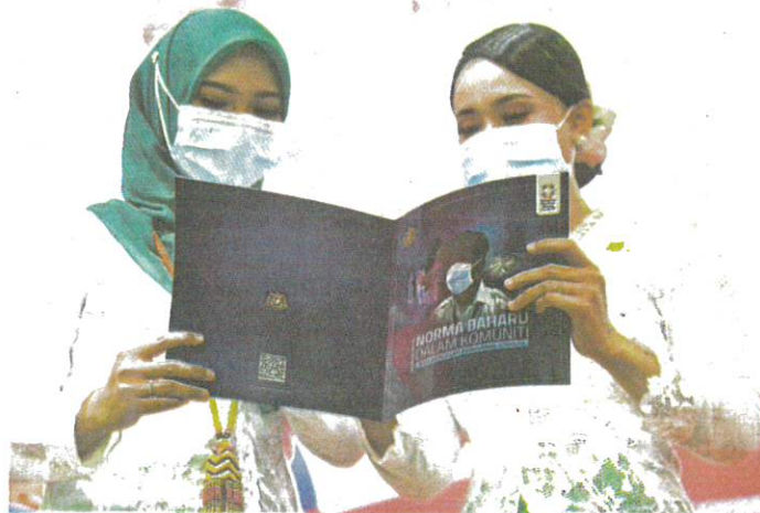
Two women looking at the 26-page book published by the Health Ministry. It was launched in conjunction with the Embracing New Norms Campaign in Pagoh yesterday.

Present were Senior Defence Minister Datuk Seri Ismail Sabri Yaakob, Communications and