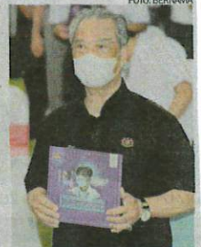
Muhyiddin memegang buku Pembudayaan Normal Baharu Komuniti terbitan Kementerian Kesihatan yang dilancarkan beliau pada Kempen Pembudayaan Normal Baharu di Muar semalam.

“Sehubungan itu, kerajaan telah membuat keputusan untuk mengenakan kuarantin wajib kepada mana-mana individu yang pulang ke tanah air melalui pintu masuk sempadan antarabangsa,” katanya.