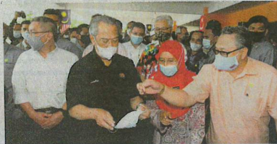
Muhyiddin (tengah) mendengar penerangan mengenai pembastan pelitup muka pabrik sebelum merasmikan pelancaran Kempen Pembudayaan Normal Baharu di Muar semalam.

“Selain itu, jangan lupa untuk sentiasa amalkan 3W iaitu wash atau kerap mencuci tangan dengan air